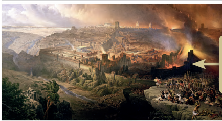
Obalenie i zniszczenie Jerozolimy przez Rzymian pod wodzą Tytusa, AD 70, David Roberts (1850)

„Gdyby Izrael jako naród zachował wierność wobec nieba, Jerozolima, wybranka Boża, stałaby na wieki.”