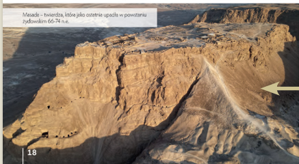
Masade – twierdza, która podo ostatnie upadła w powstaniu żydowskim 66-74 n.e.

Chrystus widział w Jerozolimie symbol świątyni zarwanego w nieważnie i bunie, zmiernającego na spulchnienie karzących wyroków Bożych. Nicieule odwołują ludzi, jakie odzwalał całą swą istotą, sprawiły, że Jęgo ust wydobył się pełen bezbrzeżnej goręczy krzyk. W ludzkiej nędzy, łzach i krwi widział zapis grechei, Jęgo serce przenikało niesiofione współczucie dla cierpiących i dotkniętych nieszczęściami; pragnął przynieść im ulęę. Jednak nawet Jęgo ręką nie mogła zawoć strumienia łudzięć nieoilei, niewielu chciało szukać jedynego Zródła pomocy. Gotów był wdać na śmieć własną duszę, aby zapewnić im dostęp do zbawienia; niewielu jednak chciało przysłać: „Jerozolim, by mić żyć.”